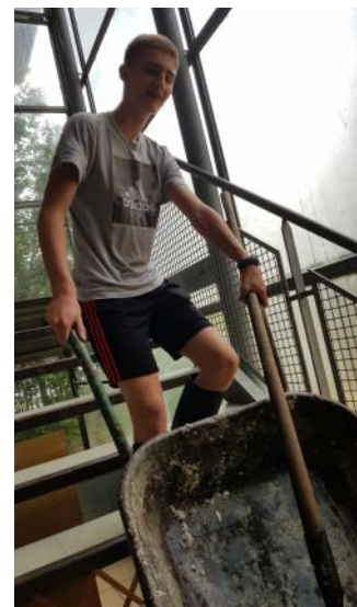
Un jeune venu aider juste après la grêle

Nous faisons le maximum pour réparer au plus vite tout cela. Un merci particulier aux mairies de Romans et de Bourg-de-Péage, et aux bénévoles de notre paroisse qui se donnent sans compter !